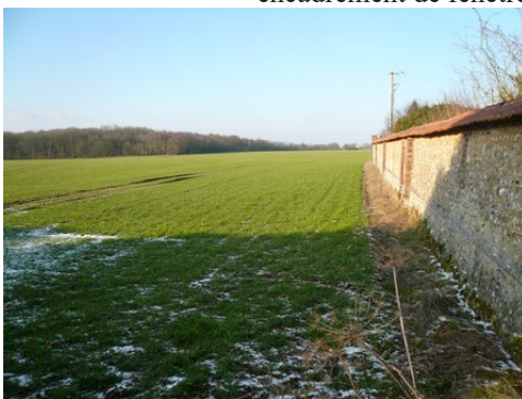
L'enceinte du parc

Pour le reste du périmètre de 500m Les avis seront cohérents avec ceux émis ces dernières années, à savoir : pas de maisons à volume compliqué (type V, W, Y, ou Z), pentes à 45° pour les volumes principaux, ardoise ou tuile plate de teinte brun vieilli, à 20u/m 2 , avec un débord de toiture de 20cm, enduit de teinte beige clair avec modénatures (au choix : chaînages, encadrement de fenêtres, soubassement, colombage...). *Voir les autres fiches.