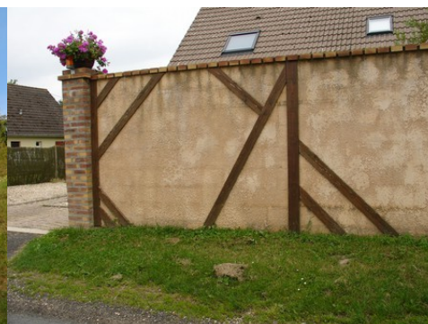
Un exemple de mur de clôture récent