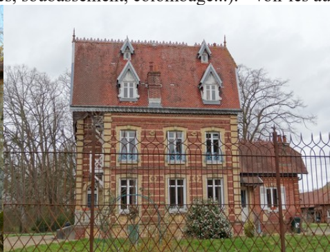
Le bâti rural avoisinant