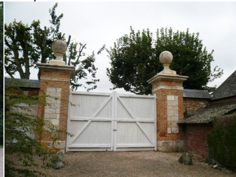
Un portail d'accès à la cour d'honneur

Pour la zone en rose foncé dans le périmètre de 500m Il est préférable d'éviter les constructions qui viendraient au dessus de la ligne de paysage existante (maison à deux niveaux, bâtiments agricoles de type silo, château d'eau, éolienne...). Les projets éoliens ne doivent pas se trouver dans l'axe majeur du château à moins de nuire irrémédiablement à son caractère. Les constructions nouvelles devront respecter le style existant : maisons parallélépipédiques (pas de V, W, X, Y ou Z). Les toitures seront à minima à 45° pour de l'ardoise ou de la tuile plate de teinte brun vieilli à rouge vieilli à 20u/m 2 . Les pignons seront droits (pas de croupe ou à 65°). Les constructions seront Rez-de-Chaussée plus combles (mais pas R+1+C). Les constructions en brique et colombage sont à préserver et à développer. Les enduits ne seront ni blanc, ni gris, ni noir mais plutôt dans les beiges (clair ou foncé) et ocre léger (mais pas toulousain). Des modénatures seront réalisées en soubassement mais aussi autour des baies (portes et fenêtres) de manière privilégiée en brique ou en colombage. Les portails et murs seront en adéquation avec l'environnement proche. Les rives de toiture seront débordantes de 20 cm. La bichromie architecturale des façades devra être recherchée.