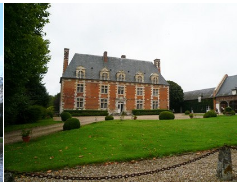
La façade est