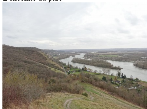
La vallée de la Seine