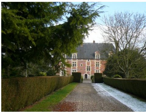
La façade ouest (vue éloignée)