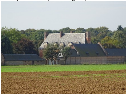
Le manoir vu des champs voisins