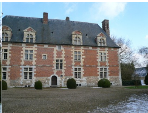
La façade ouest (vue rapprochée)