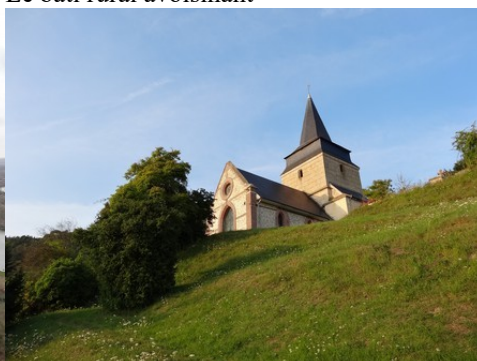
L'église d'Amfreville sous les Monts